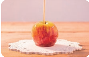
あっぷりてい りんご飴