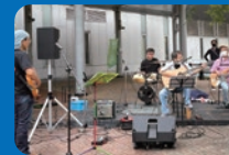
B&Jファミリーバンド