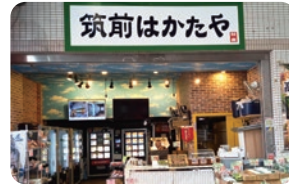
筑前はかたや 朝倉の野菜・果物