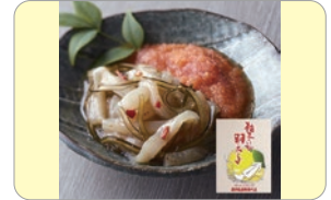
原口海産物店 柚子イカめんたい