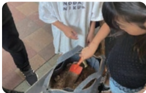
箱商連/SAITO コンポスト