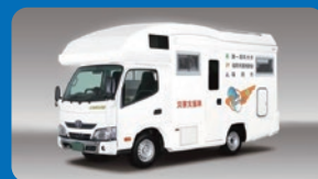
モバイルファーマシー (お薬カー)がやってくる!