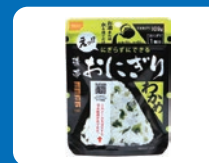
防災用おにぎりの 展示配布

●注意事項 ※出店者やアーティスト、出店内容は都合により変更・中止となる場合がございます。予めご了承ください。※各出店ブースの商品提供数には限りがあるため、無くなり次第販売終了となります。※ご来場の際は、アルコール消毒・マスクの着用・ソーシャルディスタンスの確保をお願いいたします。※37.5℃以上の発熱がある方や体調がすぐれない方のご来場はお控えください。※荒天の場合は、事前の予告なく中止となる場合がございます。