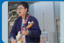
a fool hippo