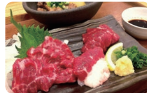
がっば工房 馬肉料理