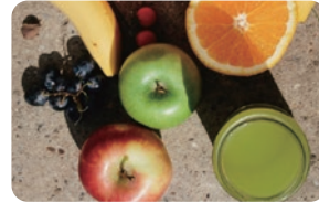
佐藤商店 ミックスジュース