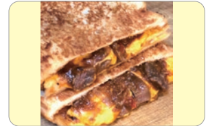
青空キッチン ホットサンド・飲料