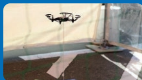
ドローン体験コーナー