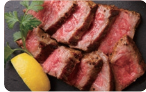
肉バルノダニク・牛タン焼のだにく 焼肉どんぶり、クラフトビール etc.