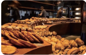
パンストック パン